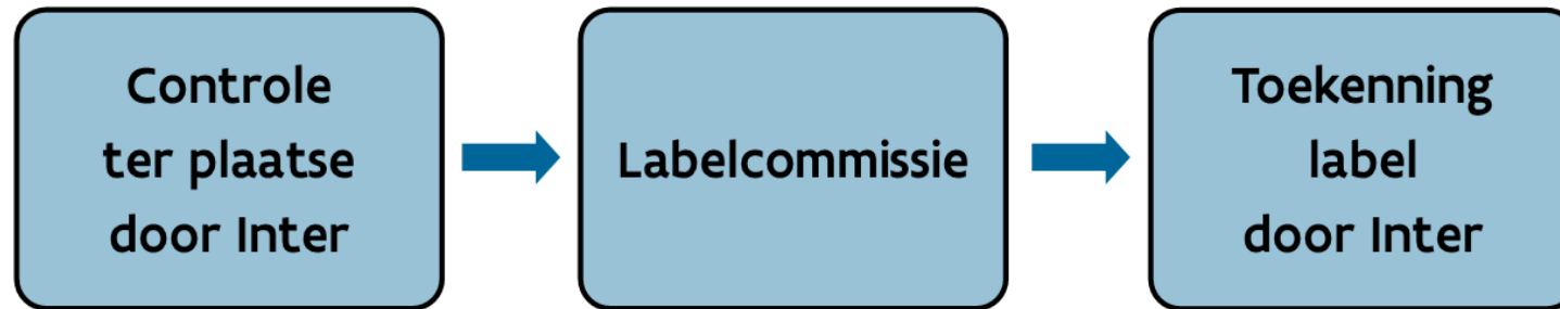
Schema 3: procedure bestaande gebouwen

Bij bestaande gebouwen wordt een controle uitgevoerd door Inter. Op een labelcommissie wordt dit (al dan niet) goedgekeurd, waarna de toekenning van het label volgt.